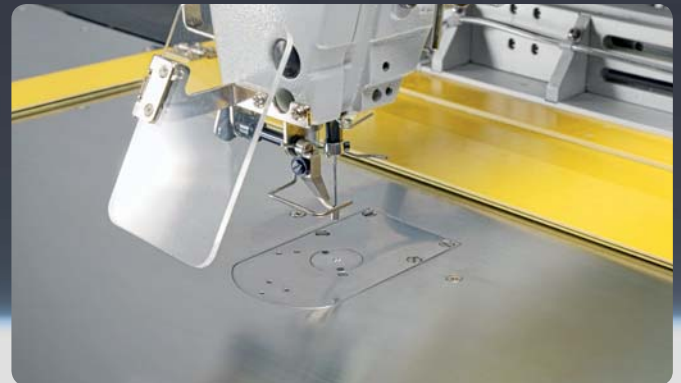
Sewing area TC 6040 G // Nähbereich TC 6040 G