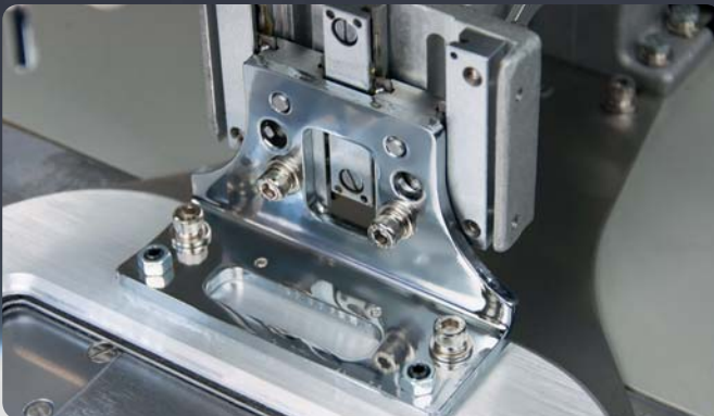
Adjustment screws TC 1310 G // Einstellschrauben TC 1310 G